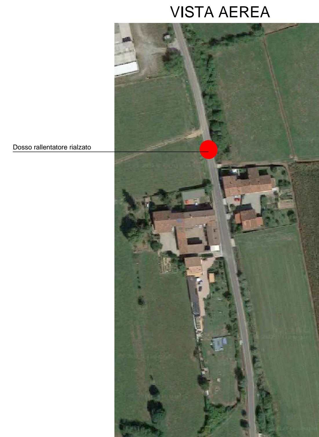
Dosso rallentatore rialzato